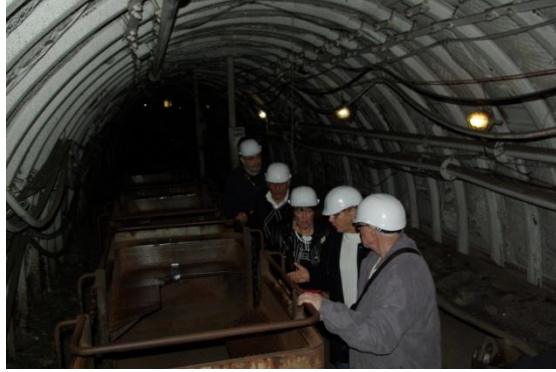
Promenade au cœur de la mine