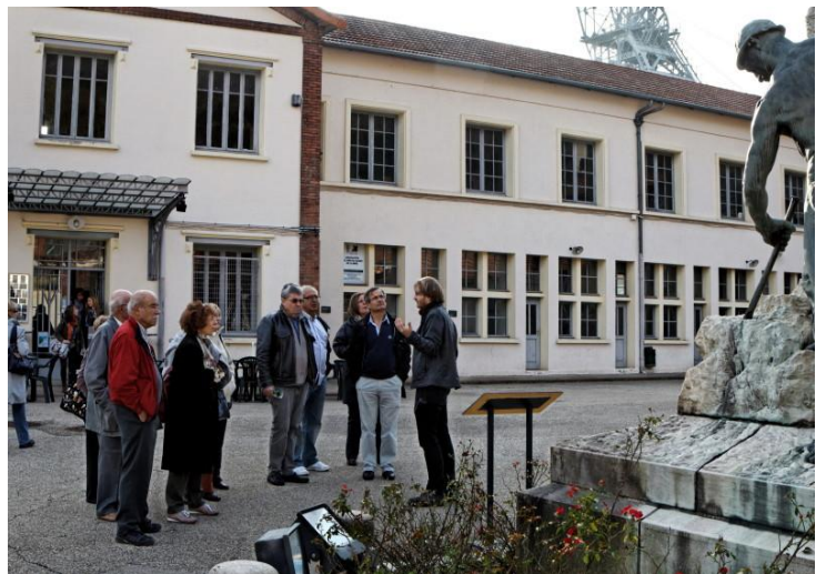
Départ de la visite devant le monument aux morts

Le Puits Couriot, que nous allons parcourir est un exceptionnel ensemble patrimonial et muséographique à deux pas du centre ville de Saint-Etienne. Avec ses deux crassiers et son chevalement édifié en 1914, il est le dernier grand témoin de l'aventure minière du bassin stéphanois, et abrite depuis 1991 le Musée de la mine de Saint-Etienne.