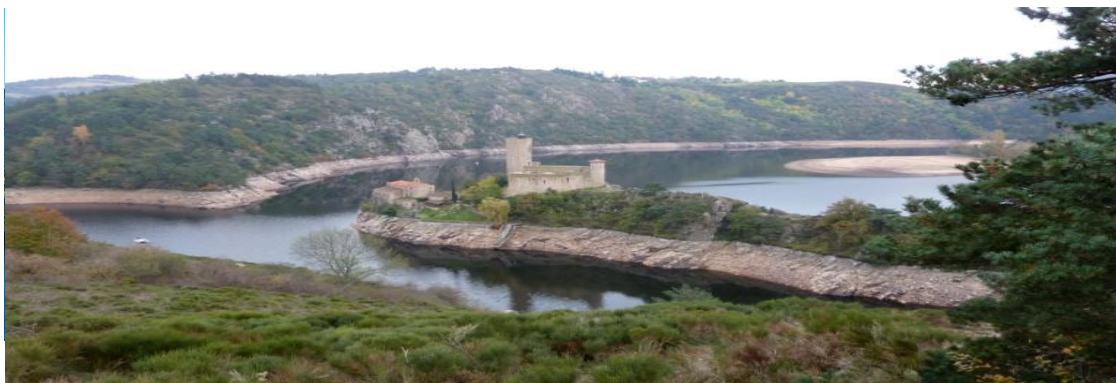
Loire et le château de Grangent