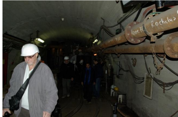
Bientôt arrivé à la fin du voyage

Après la remontée à 25m/s pendant une vingtaine de secondes ( la galerie étant à -10m, cherchez l'erreur !..), direction la campagne pour se restaurer .