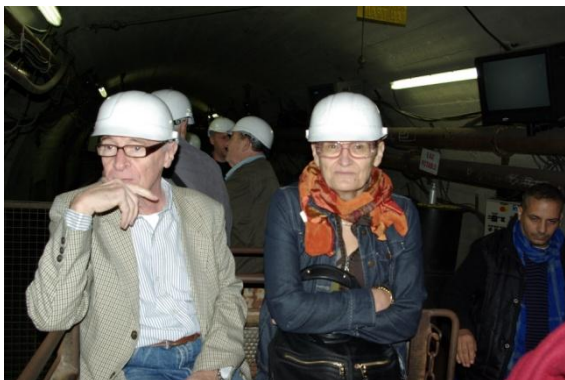
Ballade en petit train