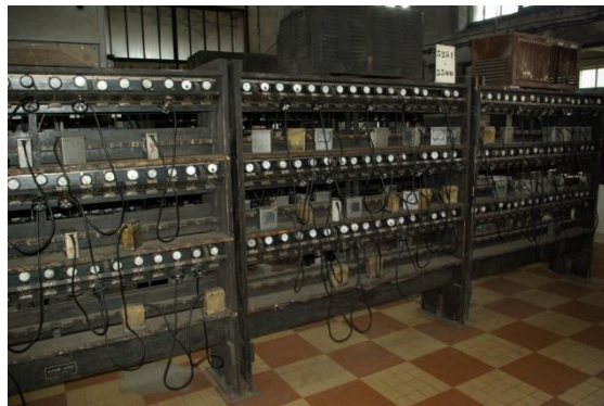
Salle des lampes