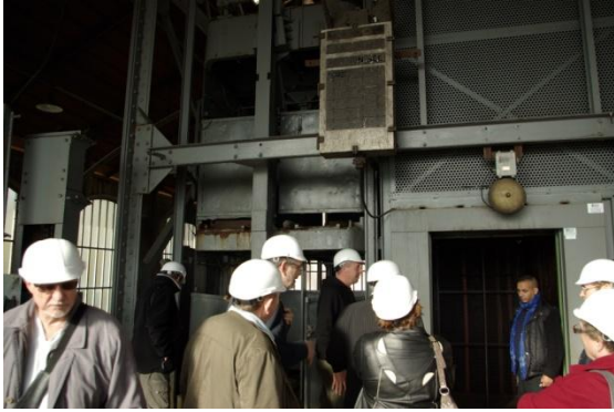
Prêt pour descendre à 750m.