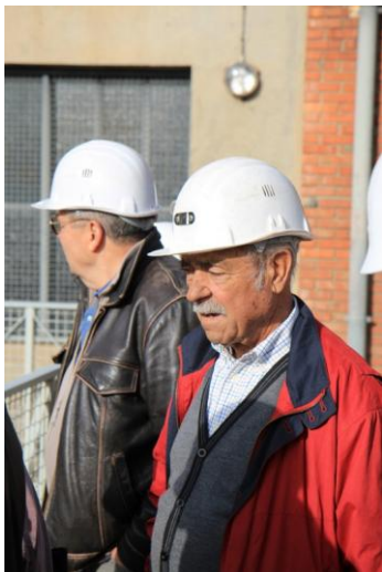
Fini la retraite à 50 ans